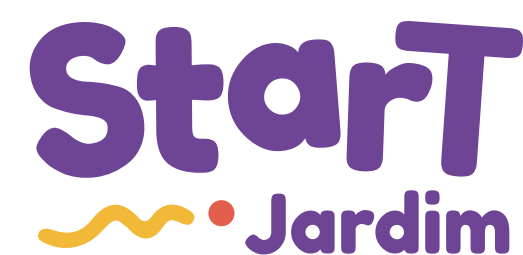
Entre 4 e 5 anos